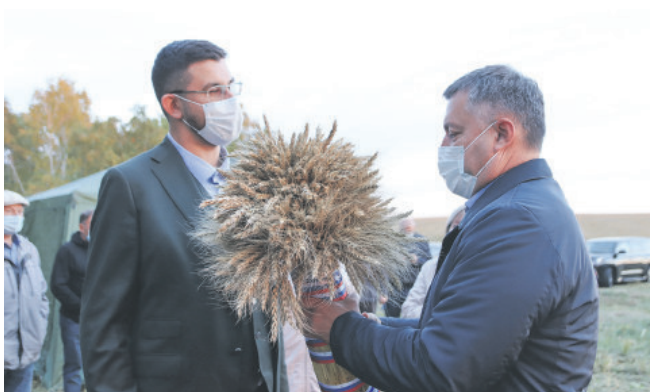
ПРИМЕР САМООТВЕРЖЕННОГО ТРУДА ГУБЕРНАТОР ИРКУТСКОЙ ОБЛАСТИ ИГОРЬ КОБЗЕВ ВСТРЕТИЛСЯ С АГРАРИЯМИ ЧЕРЕМХОВСКОГО РАЙОНА