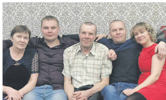
ЖИЗНЬ ИНТЕРЕСНА, КОГДА ТЫ ЧЕМ-ТО ЗАНЯТ! ОЧЕРК О ЧЕЛОВЕКЕ, ДЕЛАЮЩЕМ ЖИЗНЬ ВОКРУГ ЛУЧШЕ