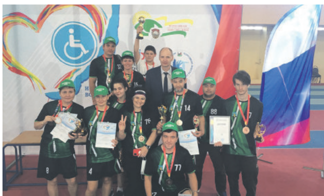
ДОСТУПНЫЙ СПОРТ, НОВЫЕ ПОБЕДЫ КОМАНДА СПОРТСМЕНОВ С ОВЗ ИЗ МИХАЙЛОВКИ СТАЛА ПРИЗЁРОМ ОБЛАСТНОЙ СПАРТАКИАДЫ