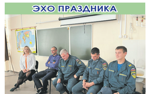
Лучше папы в мире нет!

О том, как в поселениях района отметили День отца