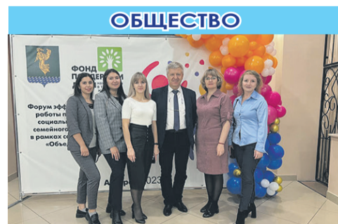
Эффективные практики по профилактике социального сиротства и семейного неблагополучия