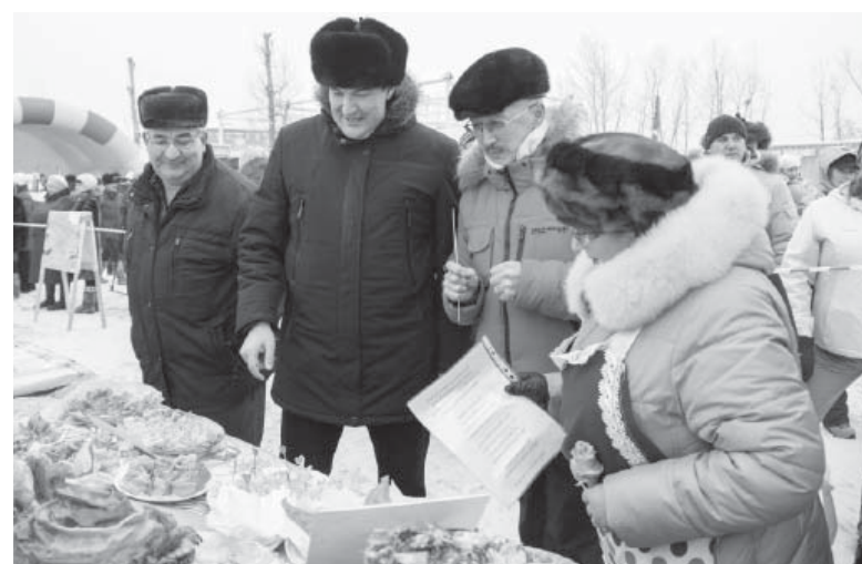
Во время фестиваля