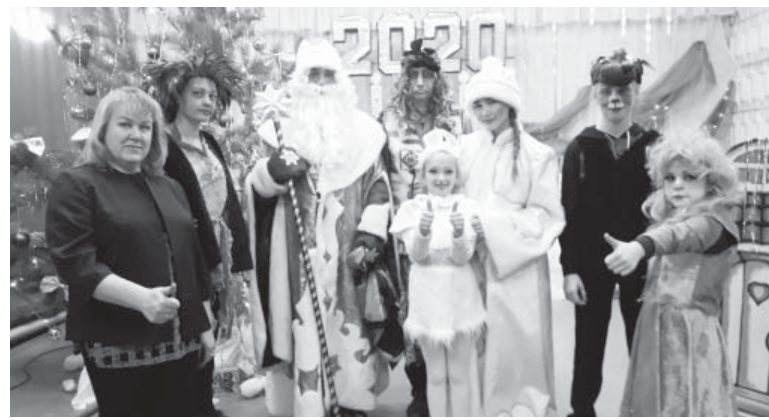
Во время праздника

Только волшебные звуки мелодии и танец маленьких снежинок смогли околдовать режиссера своим «совершенством» и унести в сказочное путешествие.