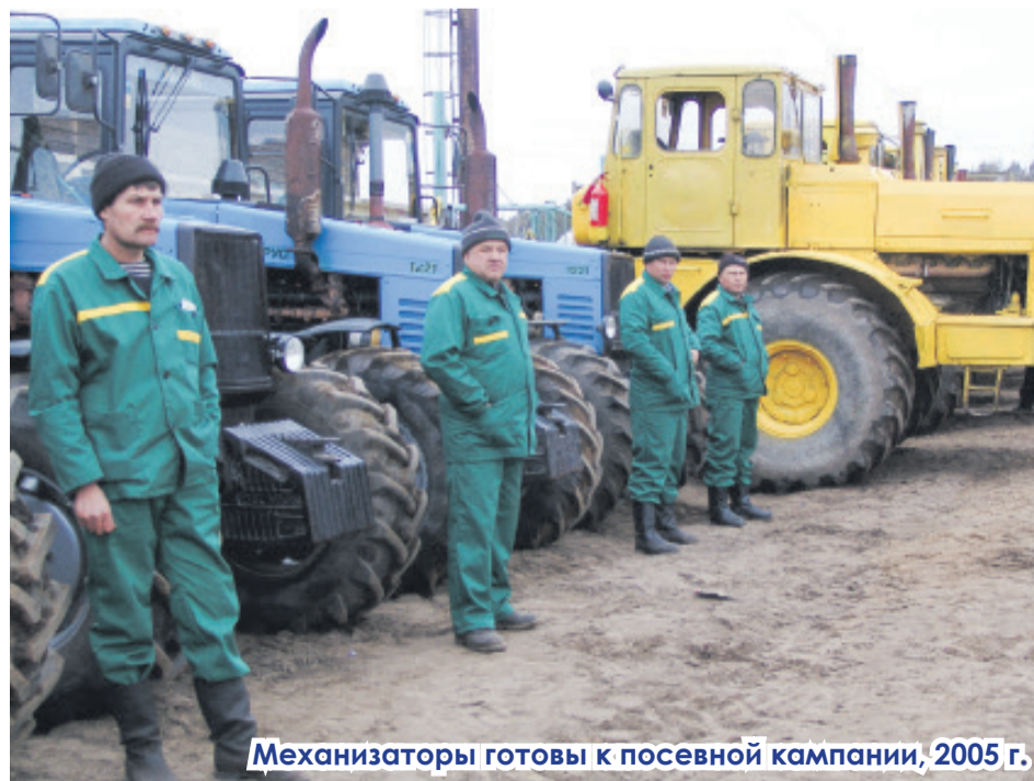
Механизаторы готовы к посевной кампании, 2005 г.

Александр ГРОММ