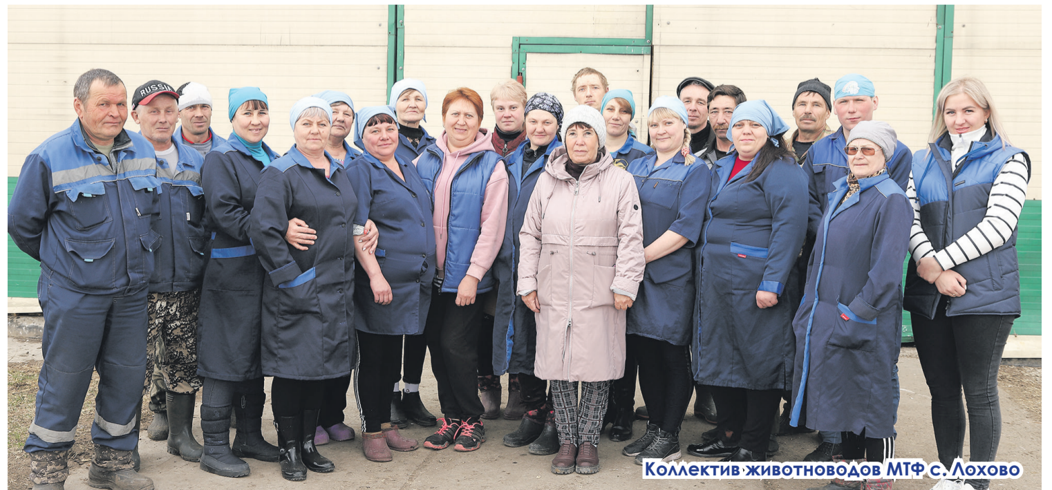
Коллектив животноводов МТФ с. Лохово