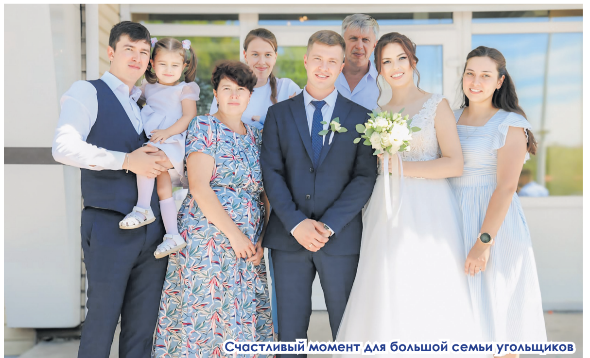
Счастливые моменты для большой семьи угольщиков