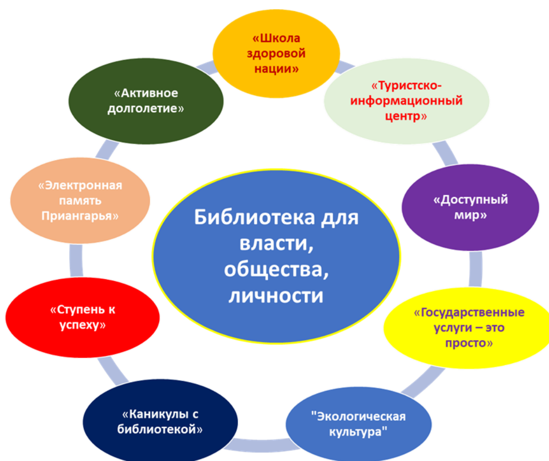
Рис. 1. Общая структура Проекта

— «Ступень к успеху» (организация обучающих мероприятий для молодежи на базе библиотек в целях развития проектного мышления, начальных навыков предпринимательской деятельности, командной работы и создания стартапов);